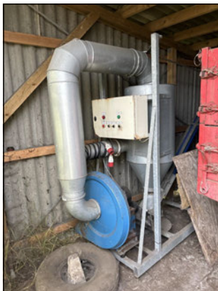
Fedtsuger Placeret i/ved BBR bygning 123