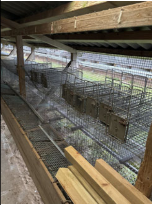
Kropstromle x2 Sorteringsfælder Placeret i/ved BBR bygning 4