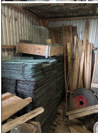
Reddekasser Hvalpenet Placeret i/ved BBR bygning 123