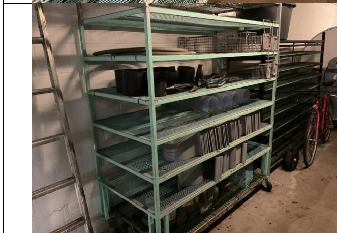
Diverse redskaber til minkproduktion.