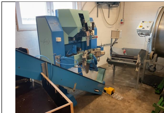
Kropsbånd og opskæringsmaskine.