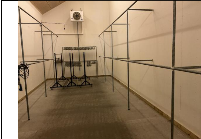
Skinvogne med bøjler.