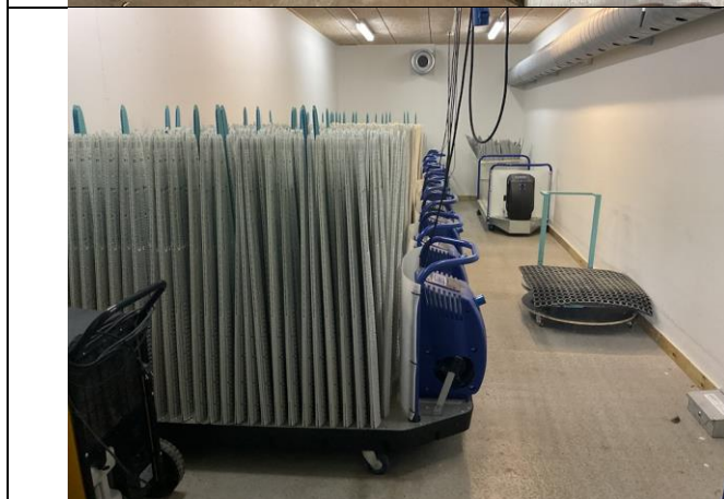
Tanere på tørrevogne, 11 stk.