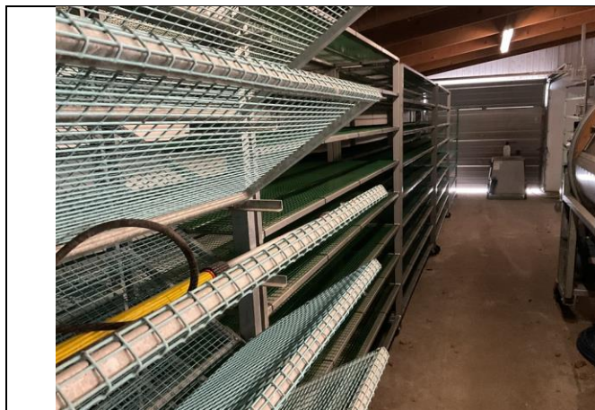
Hyldevogne og hedvandsrensere.