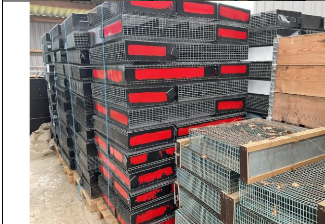
Transportkasser, 9 paller.