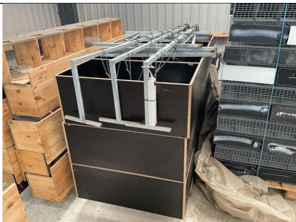
Varmekasser med lamper, 3 stk.