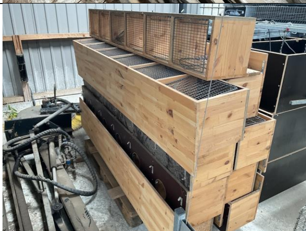
Redekasser, 1 paller.