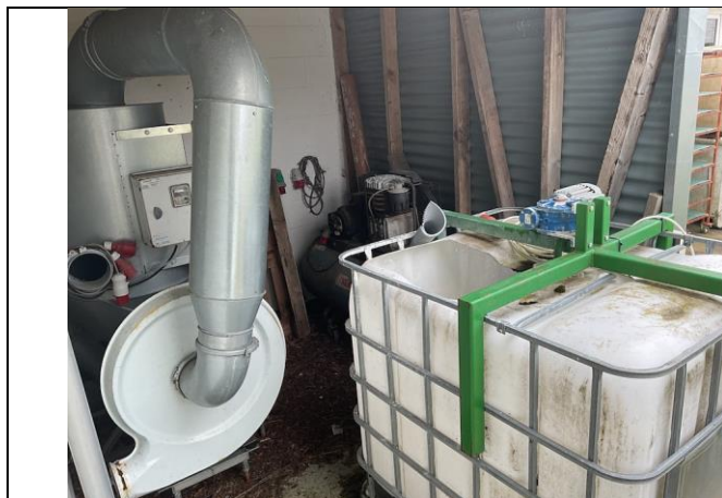
Fedtpumpe, kompressor og blandekar.