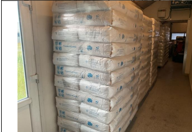
Træmel, 8 paller.