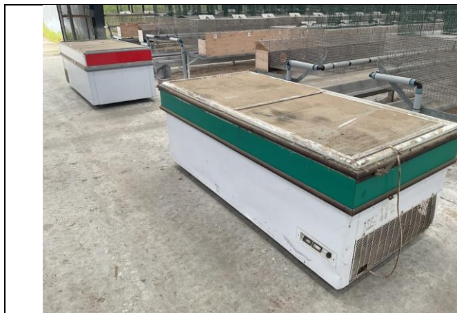
Frysere, 2 stk.