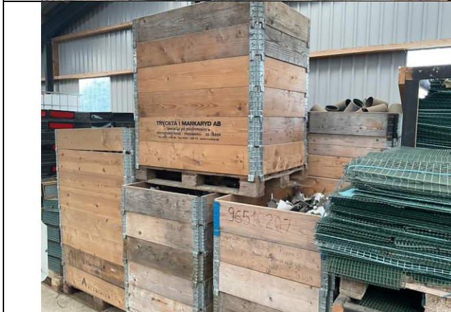
Læsluser, legerør og halmbånd, 10 paller.