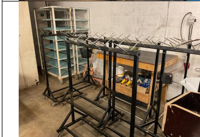
Pigvogne, hyldevogne og diverse redskaber.