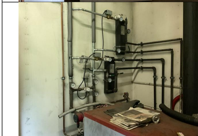
Varmevekslere, 2 stk.