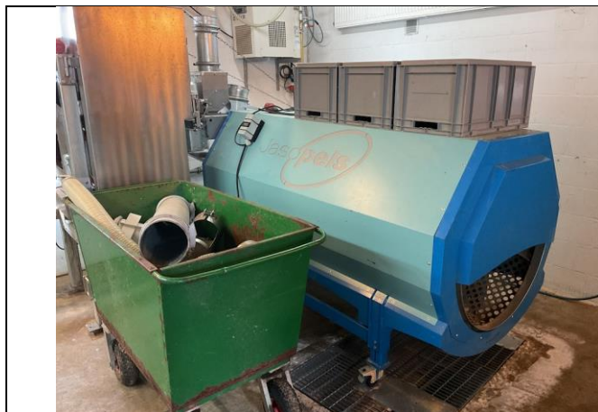
Skinromle til skrabemaskine.