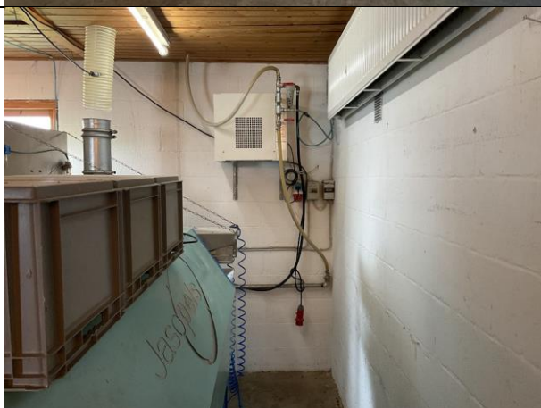
Køletørrer til kompressor.