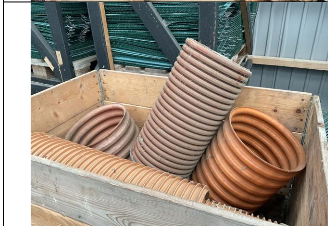
Gyllerør, 1 palle.