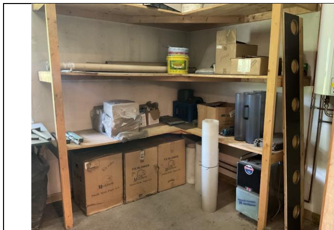
Diverse redskaber til minkproduktion.