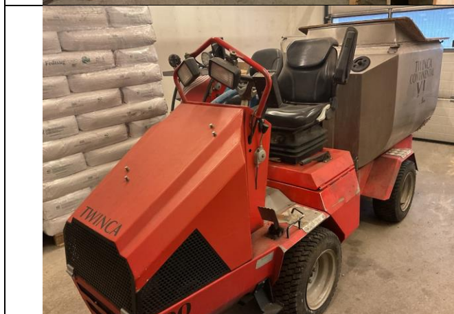
Fodermaskiner, 2 stk.