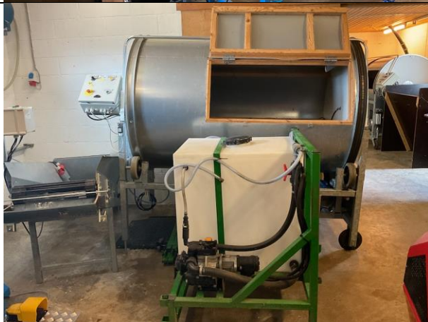
Kropstromle og redskab til minilæsser.