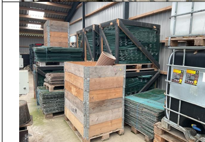
Hvalpenet, 10 paller.