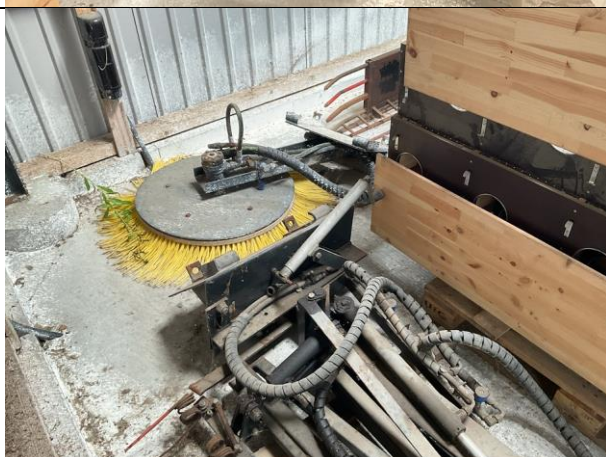
Diverse redskaber til minilæsser.