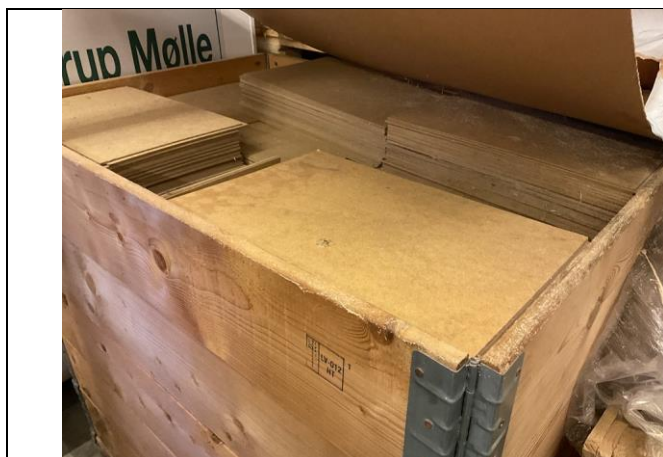
Læplader, 1 palle.