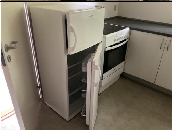
Kølefryseskab, 2 stk.