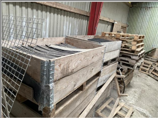
#B3.18 Placering: Bygning 4 Plastikindsatser