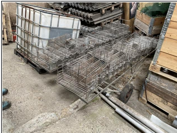
#B3.16 Placering: Bygning 4 Fældevogne med fælder