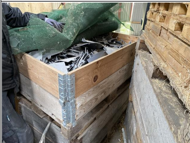
#B3.17 Placering: Bygning 4 Plastik læsluse